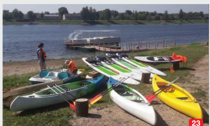
23 Ūdenstūrīsmas centrs “Balta Kaza” / Water tourism centre “Balta Kaza” / Центр водного туризма “Балта Казя”

LV Pārceļtaves pakalpojumi starp Skrīveriem un Jaunjelgavu, ekskursijas ar kuģi. Kanoje laivu, SUP, kataramarānu, makšķerēšanai (ar 5z/s motoru), velospīdēju noma, atpūtas namiņi. EN A small barque offers transportation across river Daugava to Skrīveri, municipality, excursions along river on a barque “Balta Kaza”, rent of canoe, SUP, catamarans, bicycle, rafts, boats (5 HP engine), fishermen's cabins, velospīdēju noma, atpūtas namiņi. RU Тримаран предлагает услуги переправы в Скривери через реку Даугава, аренду катамаранов, каноэ, СУП, велосипедов, лодок с мотором 5 л/с (не надо прав). Jaunjelgava | +371 29442587 | www.kugisbaltakaza.lv