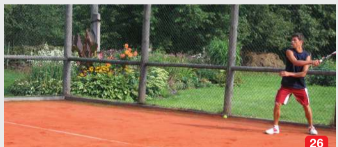
26 Tenisa korti / Tennis court / Теннисный корт

LV Šautuve, kur tiek piedāvāta iespēja trenēties gan pieaugušajiem, gan bērniem. EN A shooting range suitable as well for adults as kids. RU Стрельбище “Даугава” предлагает место для тренировки как для взрослых, так и для детей. Sērenes pag. | +371 26637093 | sautuve@sautuvedaugava.lv