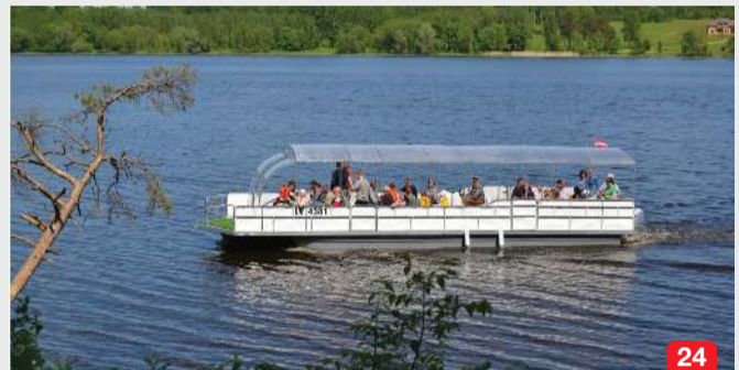
24 Ekскурcijas/izbraucieni pa Daugavu ar kuģi “Vigante” / Excursions along river on a barque “Vigante” / Экскурсии/походы по Даугаве на тримаране “Виганте”

LV Pārceļtaves pakalpojumi starp Skrīveriem un Jaunjelgavu, ekskursijas ar kuģi. Kanoje laivu, SUP, kataramarānu, makšķerēšanai (ar 5z/s motoru), velospīdēju noma, atpūtas namiņi. EN A small barque offers transportation across river Daugava to Skrīveri, municipality, excursions along river on a barque “Balta Kaza”, rent of canoe, SUP, catamarans, bicycle, rafts, boats (5 HP engine), fishermen's cabins, velospīdēju noma, atpūtas namiņi. RU Тримаран предлагает услуги переправы в Скривери через реку Даугава, аренду катамаранов, каноэ, СУП, велосипедов, лодок с мотором 5 л/с (не надо прав). Jaunjelgava | +371 29442587 | www.kugisbaltakaza.lv