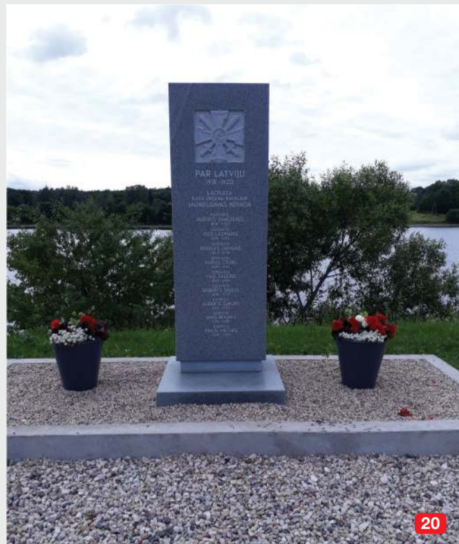
20 Stēla „Neatkarības kara varoņiem” / Monument to „Heroes of War of independence” / Стела “Героям войны независимости”

LV Jaunjelgavas novadā dzimušajiem Lāčplēša Kara ordeņa kavalieriem veļtā pieminās zīme. Atklāta 2017. gada 2. novembrī. EN A memorial stele dedicated to the Cavaliers of the Military Order of Lāčplēšis, born or lived in territory of Jaunjelgava municipality, was unveiled in November 2017. RU Памятник кавалерам ордена Лачплеша, которые родились или жили в Яунжелгавском самоуправлении. Памятник установлен 2 ноября 2017 года. Jaunjelgava