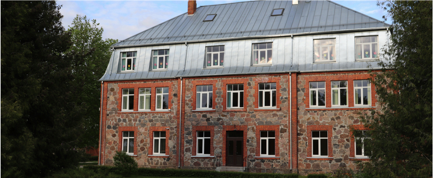
Dignājas pamatskola.

Kopienu sadarbības tīkla "Sēlijas salas" informatīvais izdevums