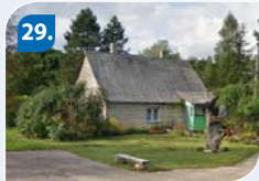
29. "Priednieki", Rubenes pagasts, t. 65228160 56.1389, 25.9855

Brīvdabas māja "Priednieki" Holiday House "Priednieki" Дом отдыха "Priednieki" («Пriedниеки») Atrodas pie Rubenes dabas parka. Pieejamas vietas skaits – 4 personas. Pieejamas telšu vietas. Iepriekšēja pieteikšanās.